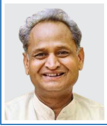
अशोक गहलोत मुख्यमंत्री, राजस्थान